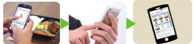
①食事の写真を撮る ②記録する ③アドバイスが届く

食事を撮影して記録すると、管理栄養士からアドバイスが届きます。 ※初めて食事を記録した日から30日間の期間限定サービスです。