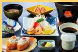
かまくら御膳(海鮮焼き)