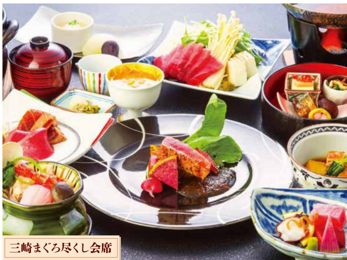
三崎まぐろ尽くし会席

な三崎まぐろを、素材の味を生かした様々な調理法でお召し上がりいただける場所がおすすめです。